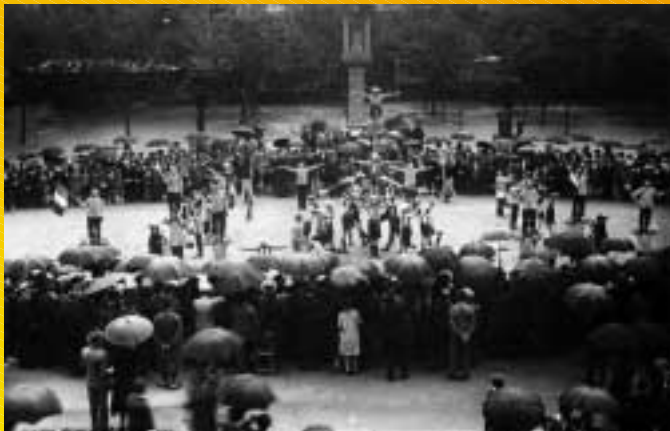
1919 - Istituzione della Festa Primaverale