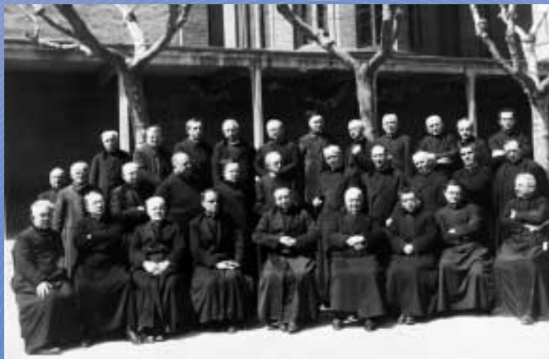
1927 - Ispettore e direttori della prima Ispettorìa Lombardo-Emiliana