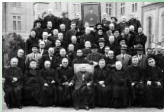
1932 - Convegno Decurioni