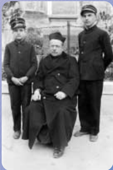
1926 Arcivescovo Card. NASALLI ROCCA Don FILIPPO RINALDI Retor Maggiore