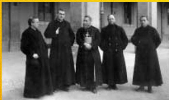
1921 - La visita del Beato Mons. Luigi Versiglia

"UN NUOVO ISTITUTO CHE DEVE TORNARE PRINCIPALMENTE A GRANDISSIMA UTILITA' MATERIALE E MORALE E A SOMMO DECORO DI QUESTA CITTA' DI BOLOGNA" (Carlo Lozzi Procuratore Generale della Corte d'Appello di Bologna 22-2-1897)