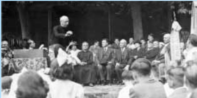
Dal 1930 Parroco al Sacro Cuore