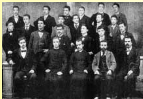
Da "AVVENIRE" 10/12/1886 (fondato 1/11/1886) 1900 - I primi catechisti dell'Oratorio San Carlino

BOLOGNA I SALESIANI A BOLOGNA L'inaugurazione dell'Oratorio Pestifer « Bologna che per prima volle il grido santo e l'opera di misericordia sia la cura e il servizio infermiore alle malattie contagiose e di ogni altra specie per le malattie sempre tanto in aumento, e che per questo ha fondato l'Oratorio Pestifer, e che per questo ha fondato l'Oratorio Pestifer, e che per questo ha fondato l'Oratorio Pestifer... »