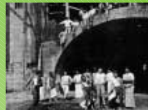
1903 - Chiesa del Sacro Cuore a Bologna: costruzione della cripta sotto il presbiterio.