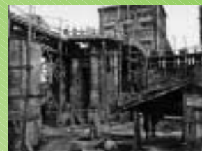
1903 - Costruzione della facciata della Sacro Cuore a Bologna.