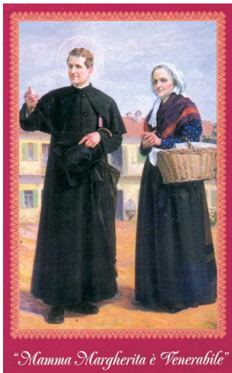
“Mamma Margherita è Venerabile”

Don Bosco, a 70 e più anni, ricorderà il tono gioioso con il quale Mamma Margherita, quando nel 1834 lui dovette decidere concretamente il suo avvenire, gli aveva detto: «Senti, Giovanni. Non ho nulla da dirti per ciò che riguarda la tua Vocazione, se non di seguirla come Dio te la ispira. Non preoccuparti per me. Da te non aspetto niente. E ritieni bene questo: sono nata in povertà, sono vissuta in povertà, voglio morire in povertà. Anzi te lo protesto: se tu per sventura diventassi un prete ricco non verrò a farti una sola visita».